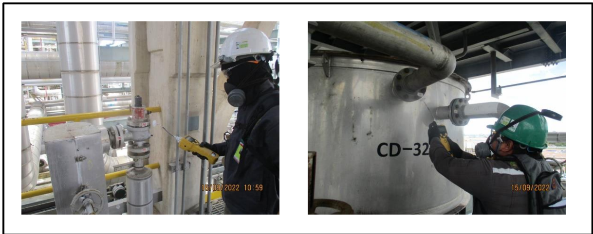
รูปที่ 1 ตัวอย่างอุปกรณ์และการตรวจวัดการรั่วซึมจากอุปกรณ์ในโรงงานที่เป็นแหล่งกำเนิดชนิดฟุ้งกระจาย